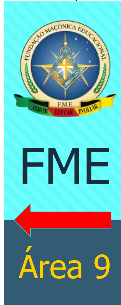
Banner localização área 9